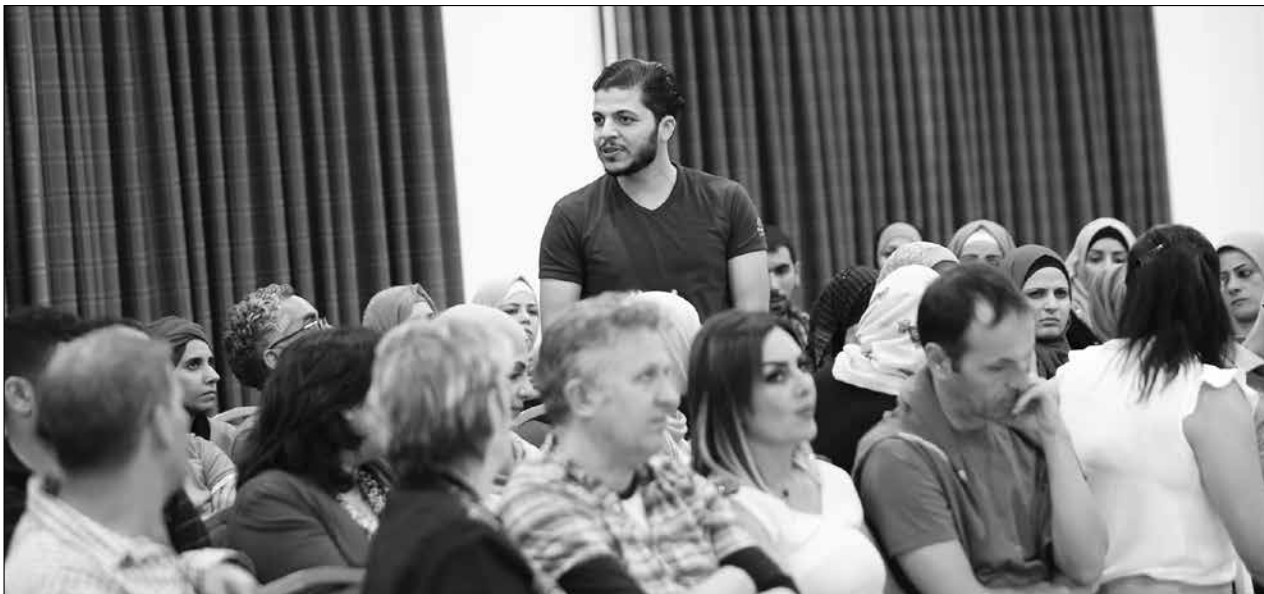
جانب من حفل افتتاح المدرسة الصيفية، 2018.

إعلانات، نتائج الإحصاء، سير ذاتية، رسوم بيانية، يوميّات، إرشادات، وثائق، رسومات، تعليمات، مقابلات، بيان تفصيلي (جرد/حصر)، دفاتر يوميّات، لصاقات وعلامات، رسائل، قوائم، خرائط، مذكرات، رسائل مشفرة، تقارير صحفية، عناوين رئيسية، ملصقات، تذاكر.