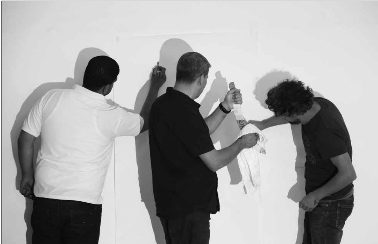
أعمال فنية أنتجها معلمون مشاركون في مسابقات المدرسة الصيفية، 2018.

بطريقة أو بأخرى، فإن كل الدراما والمسرح يخلقان معاني فيما وراء المعنى الحرفي. لا نقرأ أبداً أيِّ حدثٍ